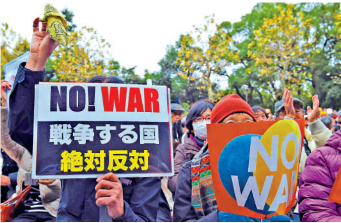
▲2015年12月，日本民眾在東京舉行反戰示威。