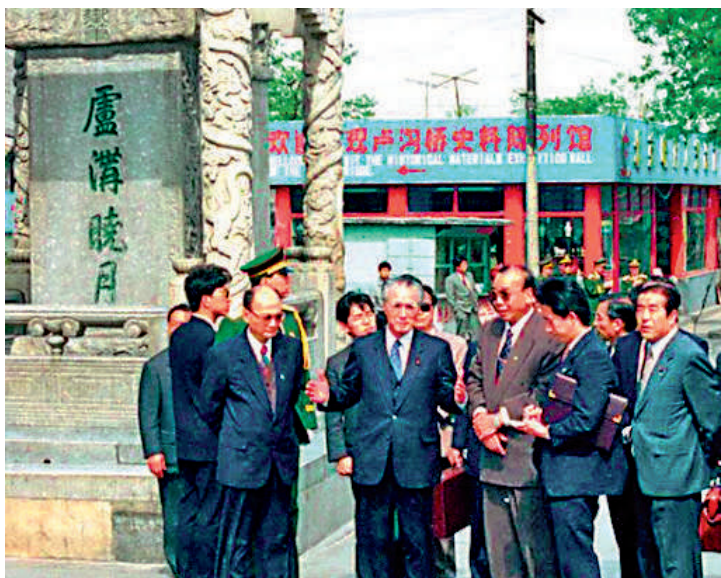
▲1995年5月，村山富市（左三）訪華期間參觀盧溝橋。資料圖片