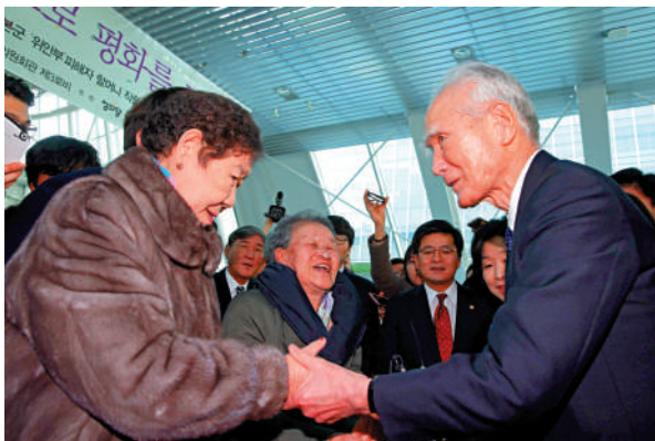
▲2014年2月，村山富市訪韓期間會見韓國慰安婦受害者。

日本政府早在1993年通過時任官房長官河野洋平的「河野談話」，承認日軍強徵慰安婦的事實。但在前首相安倍晉三任內，日本國內有部分聲音否認慰安婦歷史。村山對此感到憤慨，斥責這些言論「不可理喻，簡直不知廉恥」。他還強調，殖民統治「給韓國人民帶來了極大的損失和苦痛，日本必須痛切反省，由衷地作出道歉。」（韓聯社）