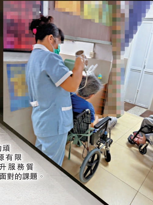
▶人手短缺是安老院舍行業的頑疾，如何在資源有限的情况下，提升服務質素，是社會亟需面對的課題。