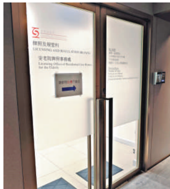
▲社會福利署表示，已加強巡視院舍，並向院友及家屬發出指引，要求院舍在收費及報銷方面，必須遵守相關規定，並提供清晰收據。

特別就發現有可疑之處或收費與規定出現較大偏差的個案，向院舍作出質詢及要求解釋，並作出深入調查。就違規的院舍，該署定必果斷採取執管行動，包括向有關院舍發出書面警