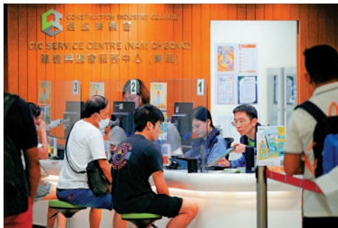
▲建造業議會為工友提供免費課程，學習短缺工種技能。

向《大公報》表示，受經濟環境影響，地產市道不振，私人工程量萎縮，當前建造行業僱主、僱員、總承包商和分包商都比較困難。工程前期的一些工種例如紮鐵、模板、落石屎等，都出現開工不足或無工開的現象。他非常歡迎政府推出優化培訓計劃，認為是更大誘因，鼓勵工友積極進取。