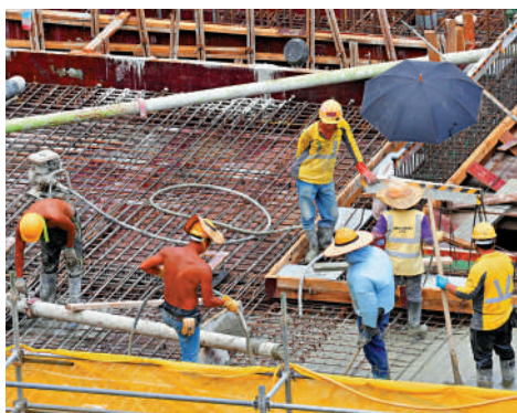
▲紮鐵工種人力緊張情況改善，當局不再批准輸入外勞。

建造業失業率近期處於較高水平，主要因為私營界別工程量減少，政府透過增加基建投資承諾，穩定市場信心。行政長官在上月發表的施政報告提出，「加碼」預留300億元，在未來兩至三年加大工程項目開支。發展局表示會善用這筆款項，推展更多中小型工程項目。