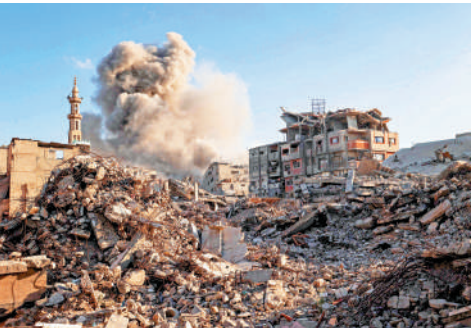
▲以軍19日空襲加沙地帶中部，造成人員傷亡。

【大公報訊】據半島電視台報道：以色列國防軍19日稱，位於加沙地帶南部拉法地區的以軍部隊當天遭到襲擊，以軍因