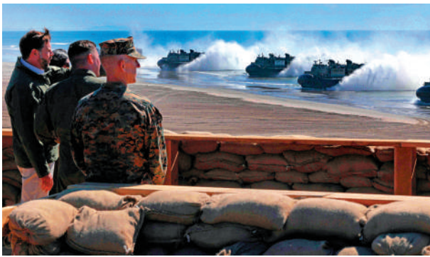
▲萬斯（左一）18日在加州觀看軍事演練。

等人面前表演實彈射擊，炮彈飛過日均通行8萬名旅客、承載9400萬美元貨運量的5號州際高速公路。美國軍方聲稱演習項目