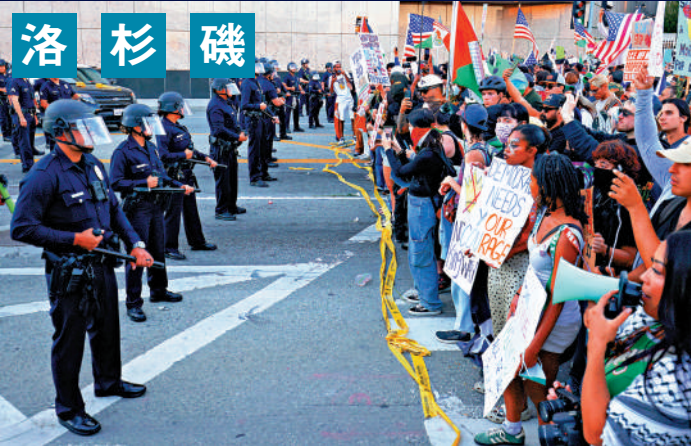
▲示威者18日在洛杉磯市中心與警方對峙。