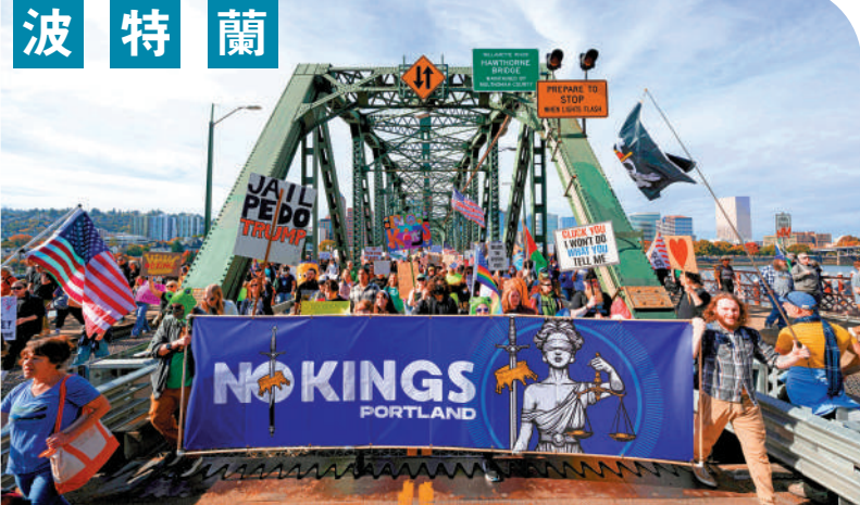
▲示威者18日聚集在波特蘭市霍桑大橋上。