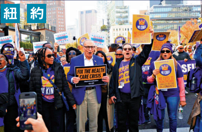
▲美國國會參議院民主黨領袖舒默（中）在紐約參加示威。網絡圖片