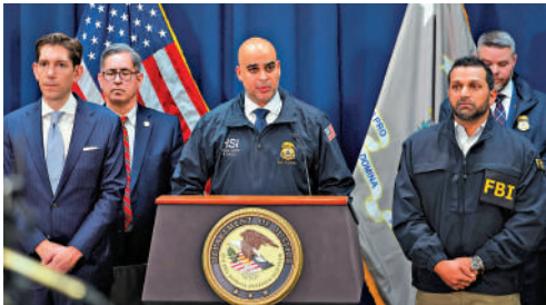
▲美國執法部門23日就案件召開記者會，圖中右前為美國聯邦調查局局長帕特爾。

另一項案件則涉及球員「打假球」和出售內部信息參與非法賭博，共6人被起訴，2023年至2024年共7場NBA比賽被做手脚。邁阿密熱火隊現役球員盧斯亞在2023年3月代表夏洛特黃蜂隊對陣新奧爾良鵜鶘