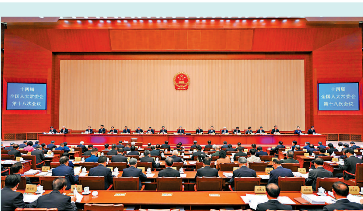
◀10月24日，十四屆全國人大常委會第十八次會議在北京人民大會堂舉行第一次全體會議、第二次全體會議，會議表決通過了全國人大常委會關於設立台灣光復紀念日的決定。趙樂際委員長主持。中新社

他強調，歷史因銘記而永恆，正義因捍衛而昭彰。我們將以設立台灣光復紀念日為契機，積極舉行各類紀念活動，開展全民涉台愛國教育。我們將團結廣大台灣同胞，共同銘記歷史、緬懷先烈，攜手推進祖國統一大業，同心開創民族復興光明前景。