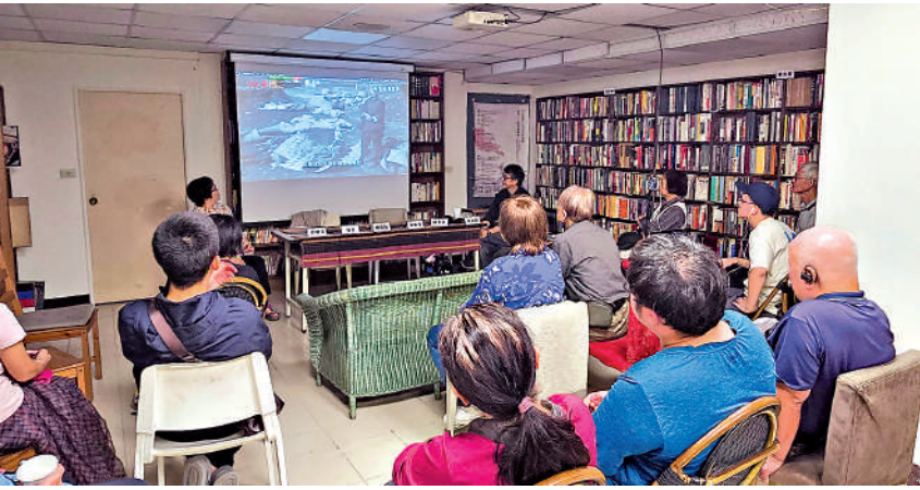
◀台灣民間舉辦紀念台灣光復80周年活動，現場放映37分鐘版馬吉影像微紀錄片。

「我們特別以放映馬吉影像作為紀念台灣光復80周年系列活動的開篇，是因為從這些珍貴影像中看到的是兩岸同胞共同的民族苦難記憶，是兩岸共同努力、鍥而不舍地為歷史留證的執著。」