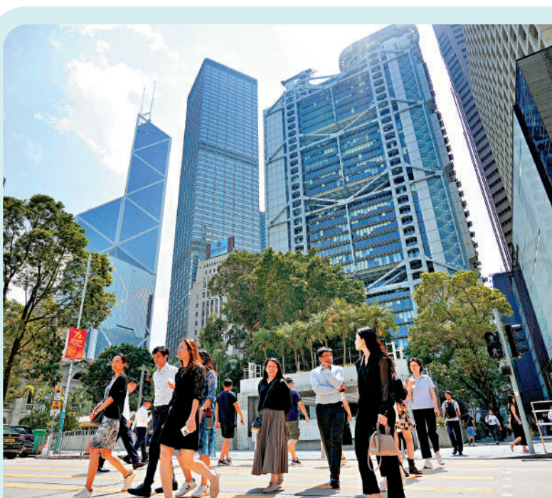
▲香港現時所有零售銀行均已採用合規科技，整體使用率達到97%。

余偉文總結說，這段金融科技旅程，已鞏固了香港在全球金融科技領域的領先地位。隨着科技持續重塑全球金融格局，香港已準備就緒，引領下一波創新浪潮，將銀行服務水平提升到更高層次。除了銀行數碼化，余偉文預告將於下周透過「匯思」繼續撰文，回顧金融科技另外兩個重點領域，即央行數碼貨幣（CBDC）和數據基建的發展歷程。