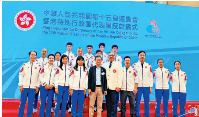
▲香港乒總主席余國樑（前排左五）早前帶領一眾港隊小將出席港隊代表團的全運授旗儀式。

余國樑堅信，此次全運會同樣會產生「示範效應」，只要運動員能在賽場上打出風采、賽出水平，就能間接影響下一代運動員，讓香港的乒乓球隊伍不斷發展壯大。