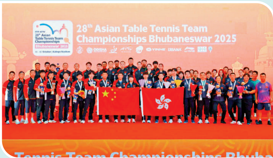
▲2025乒乓球亞錦賽頒獎儀式結束後，國乒主動邀請港隊同框合影。

青年組決賽賽程 男、女單：11月15日 男、女團：11月13日 混雙：11月11日