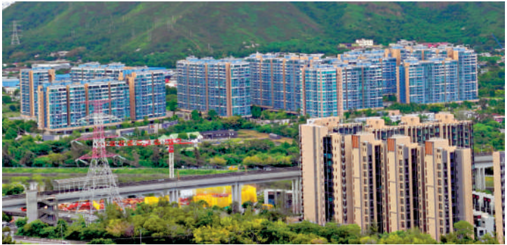
▲元朗Park YOHO有3房單位獲上車客以750萬零議價買入。