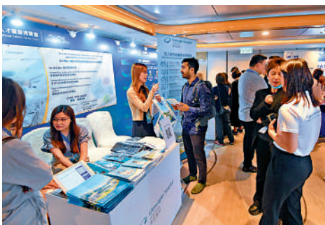
▲中央惠港新措將加強香港匯聚人才的吸引力。

六類人才可憑人才主管部門、符合條件的用人單位等出具的有關人才證明，申請辦理有效期1至5年不等的多次往來香港或者澳門人才簽注，每次在香港或者澳門停留不超過30天。傑出人才可以獲發有效期5年的人才簽注，科研、文教、衛健人才可以獲發有效期3年的人才簽注，法律、其他類人才可以獲發有效期1年的人才簽注。