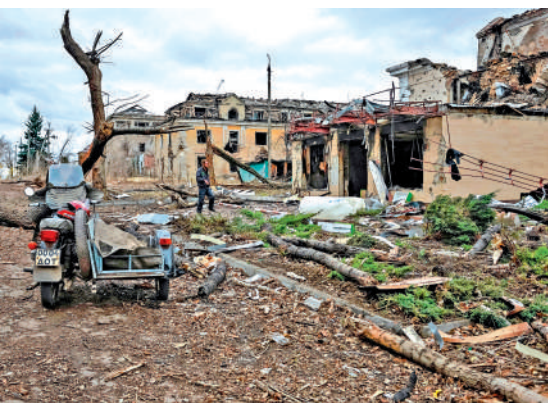
▲頓涅茨克地區靠近俄烏交戰前線的公寓樓1日遭到空襲。

烏克蘭官員2日表示，俄羅斯過去一夜發動大規模無人機和導彈襲擊，造成至少6人死亡，其中包括兩名兒童。另據路透社報道，美國已取消原定於匈牙利布達佩斯舉行的美俄峰會。俄總統新聞秘書佩斯科夫2日強調，解決烏克蘭問題需要研究各項細節，而不是倉促安排領導人會晤。