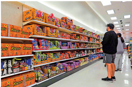
▲特朗普的關稅政策令美國企業和消費者承受壓力。

該法律對中國、加拿大和墨西哥加徵關稅，4月又援引該法律對全球多國徵收所謂「對等關稅」。美國商會批評說，特朗普的做法引發市場不確定性，美國大小企業已遭受無法彌補的損失。最高法院將在明年6月前作出裁決，但外界普遍預計明年1月就會有結果。最高法院9名大法官中6名為保守派，其中3人由特朗普任命。