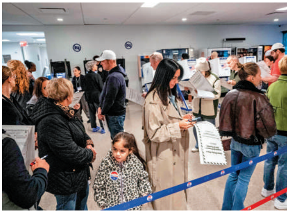
▲紐約市民2日參加市長選舉提前投票。

美國前總統奧巴馬1日分別出席斯潘伯格和謝里爾的競選集會，為他們造勢，同時尖銳批評特朗普政府。消息人士透露，奧巴馬還給馬姆達尼打電話，稱讚他的競選活動「令人印象深刻」，並表示願意充當他的顧問。