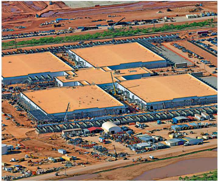
▲甲骨文和日本軟銀合資的AI基礎設施「星際之門」，目前已在美國得州開啟施工。