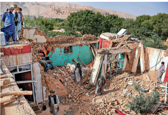
▲阿富汗北部3日發生地震，沙曼岡省一個村落的房屋倒塌。

此地震頻繁。今年8月，阿富汗東部地區發生6.0級的淺層地震，造成超過2200人死亡，是阿富汗近年來死傷最慘重的地震，預計經濟損失超過1.8億美元。