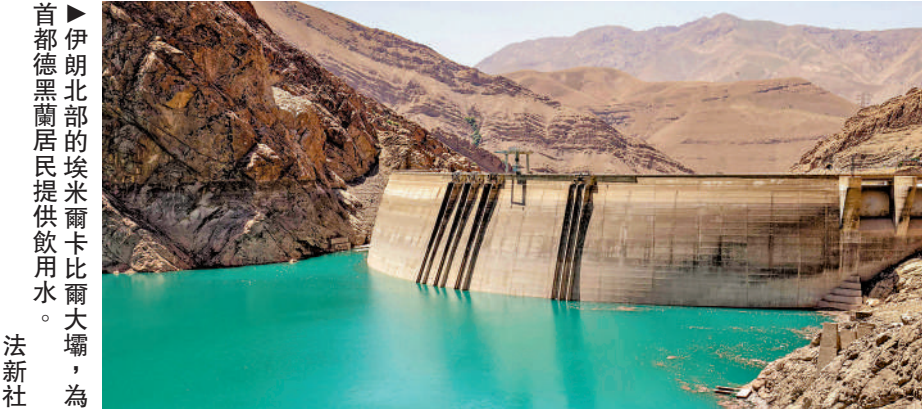
▶伊朗北部的埃米爾卡比爾大壩，為首都德黑蘭居民提供飲用水。