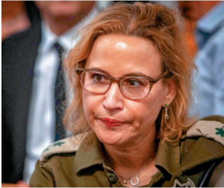
◀以色列國防軍前首席軍事檢察官耶魯沙爾米。

另外，以色列3日證實，哈馬斯前一天再向以方移交3名遇難以色列人質的遺體。10月10日，加沙停火協議生效後，哈馬斯已釋放20名倖存人質，並着手交還28名難人質遺體，迄今已交還20具遺體。