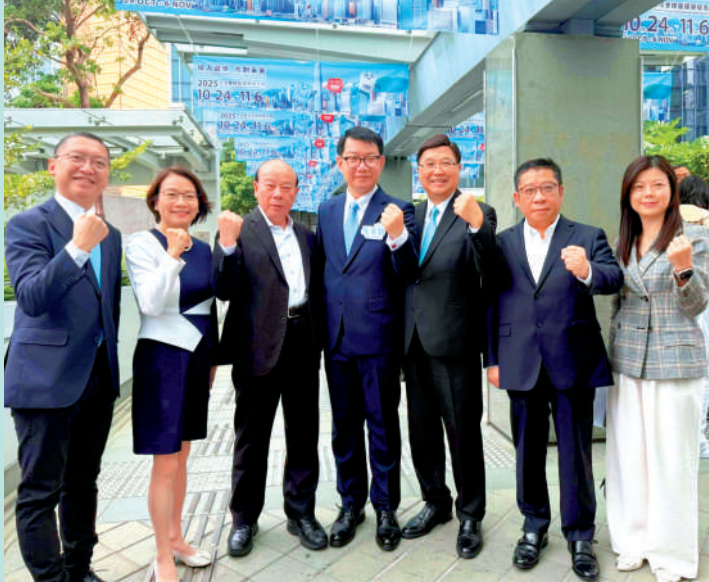
▲香港大律師、內地律師吳英鵬報名參選選委會界別。