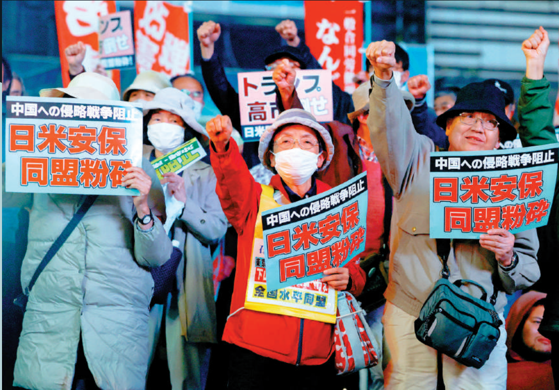
▲日本民眾10月27日在東京參加反戰示威。

高市還屢次「拜鬼」。2007年，她是安倍內閣唯一一個在日本投降紀念日參拜靖國神社的大臣。（綜合報道）