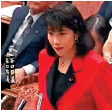
◀1994年，高市早苗叫板村山富市，試圖歪曲歷史。視頻截圖

2013年，高市作為自民黨政策研究會委員，曾建議時任日本首相安倍晉三發表一份新聲明，以「安倍談話」取代「村山談話」。此後，安倍晉三