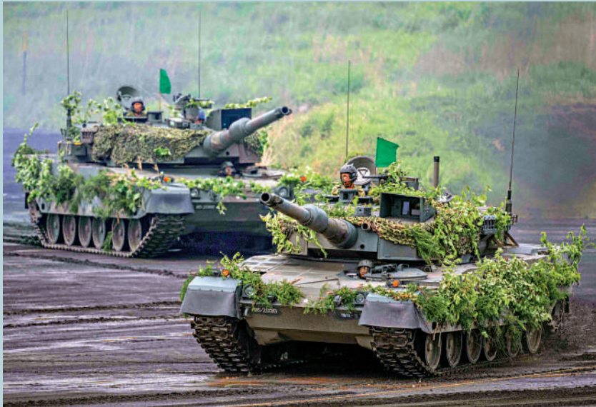
◀日本自衛隊今年5月在靜岡縣進行實彈演習。