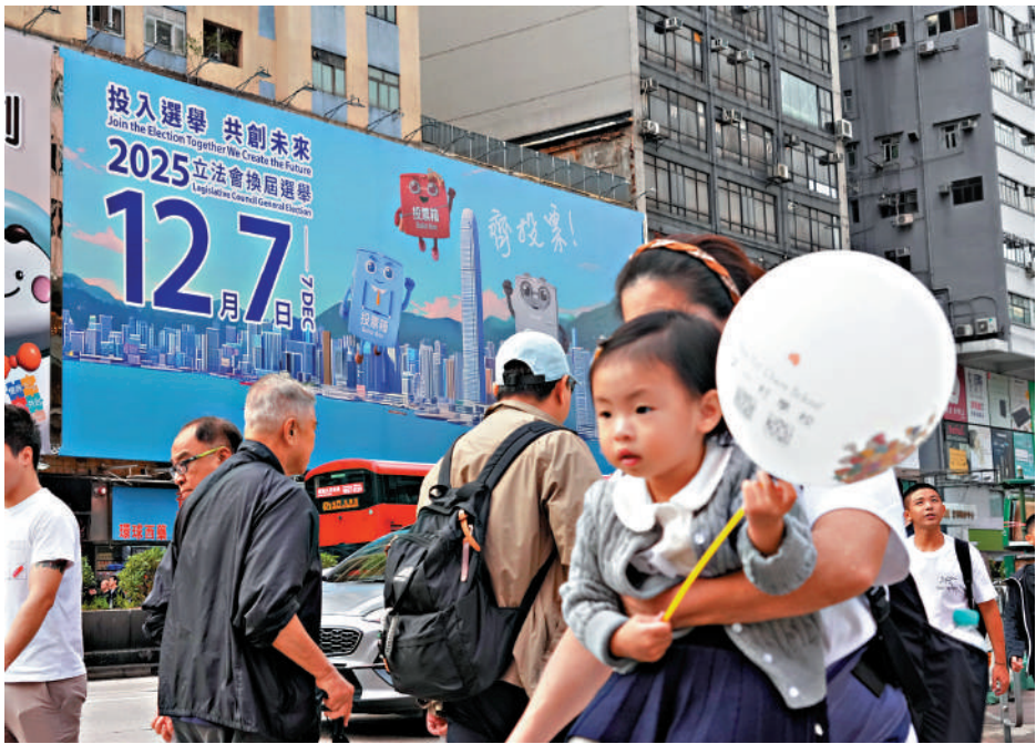
▲立法會換屆選舉將於十二月七日舉行，各個選區的選舉論壇進行得如火如荼。