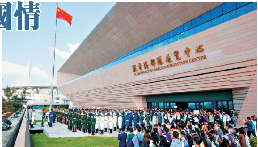
▲活動於上午9時30分舉行升旗儀式，學生們整齊肅立、高唱國歌。