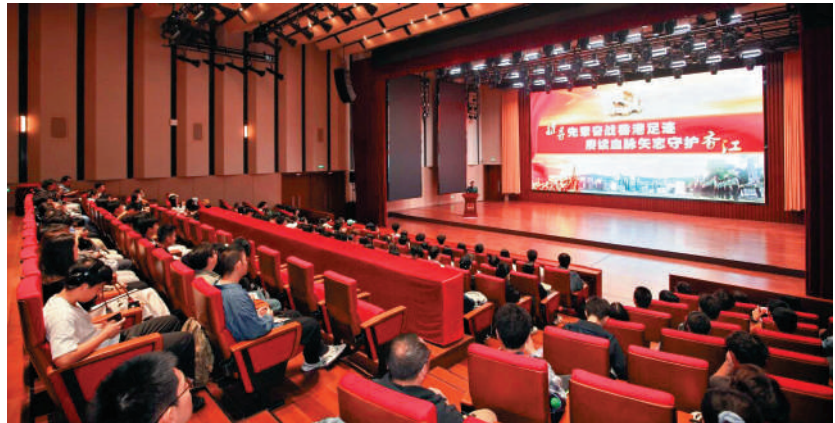
▲學生們與駐港部隊指導員進行交流，認識維護國家安全的重要意義。