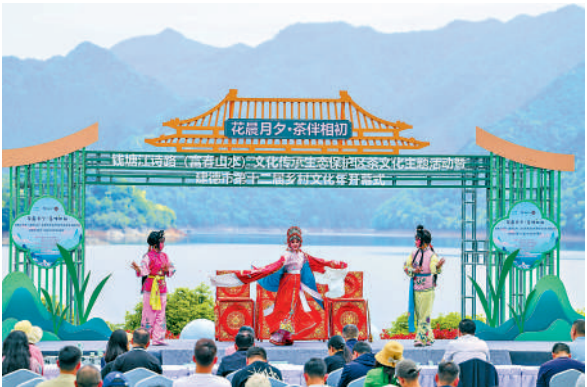
▲錢塘江詩路（富春山水）文化傳承生態保護區舉行的茶文化主題活動。