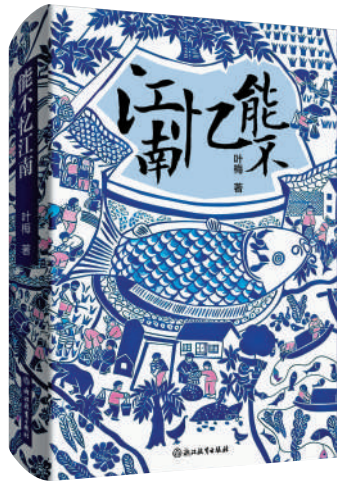
▲《能不憶江南》，葉梅著，浙江教育出版社，2025年。