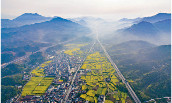
▲天目山鎮橫塘村，油菜花田與村莊、公路、群山構成一幅美麗畫卷（無人機照片）。