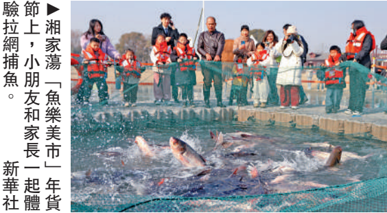
▲湘家蕩「魚樂美市」年貨節上，小朋友和家長一起體驗拉網捕魚。

嘉興湘家蕩，經過治理，變為江南水鄉的一顆明珠，鑲嵌在杭嘉湖平原的腹心地帶。掌握數字農業技術的新農人，在現代農業產業園裏，嫺熟地操作各種精密儀器。「在一處現代農業產業園裏，育秧大棚內的溫度被精準控制在20℃，嘉禾100的種子經過浸種催芽，米粒狀的胚芽剛剛頂破種皮，乳白的根鬚如幼蠶蠕動，在濕潤的空氣裏編織着生命的密碼。」天降嘉禾，嘉興人與水土共生的幸福生活，七千年前就曾與稻穀結緣，也在七千年後的光電中再造。 書中還有關於鄉村水污染治理、河流湖泊整治、生物多樣性保護等篇章，葉梅以新舊對照的縱深視野，在歷史與當下的對話中，注入積極樂觀、向美向善的時代精神，呈現一種恢宏溫暖的正大氣象。