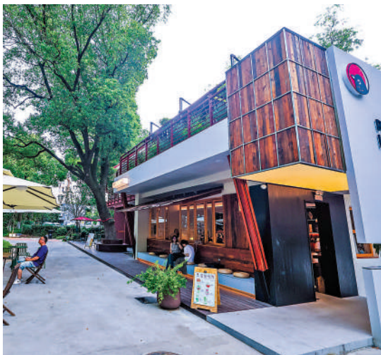
▲嘉興市南湖區創新盤活老舊工業遺存，將一處國營老廠區改造為嘉創灣花園式產業園區。