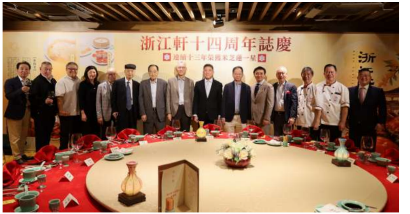
▲「浙江軒」十四周年誌慶晚宴賓主合影。

食客們多年來的信任與肯定。未來他們將依舊秉持匠心，在傳承浙菜精髓的基礎上不斷突破，為大家帶來更多舌尖驚喜。