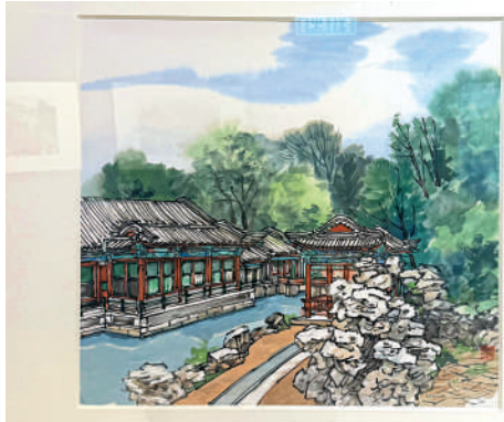
▲莊小雷作品《北海公園系列》。