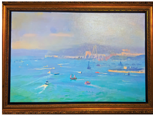
▲張路江油畫《維港溫柔》。