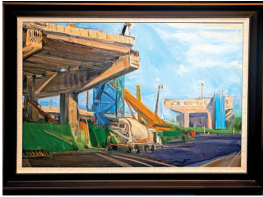
▲范迪安作品《建設中的京密高速》。