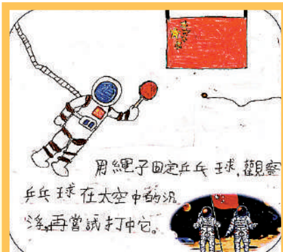
范錦好 學校：培僑書院 (小學部) 班別：1W