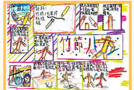
吳萃奇 學校：培僑書院 (小學部) 班別：6W