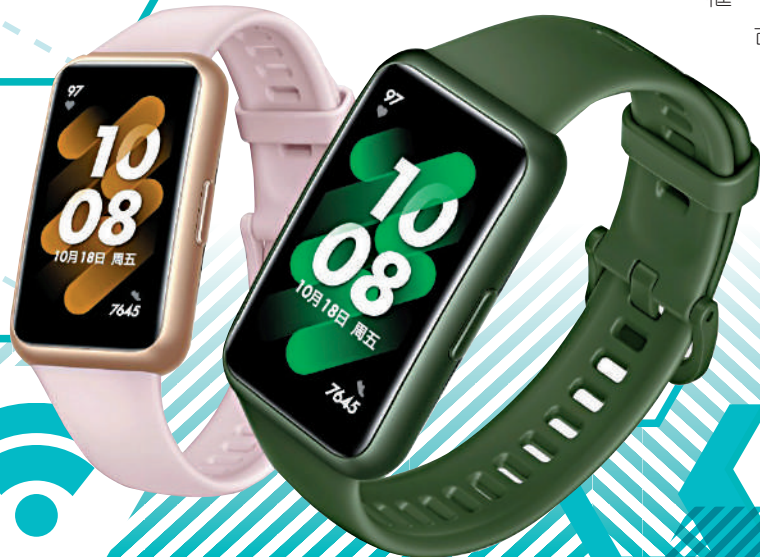
▲▼華為智能手環Band 7非常輕便。

而GT 3 Pro則是GT 3進化版，在經典外觀下，主要改進了電池技術與防水功能。現時的電池充電速度提高了30%，只需10分鐘就能充電25%，並可在30米以下自由潛水。