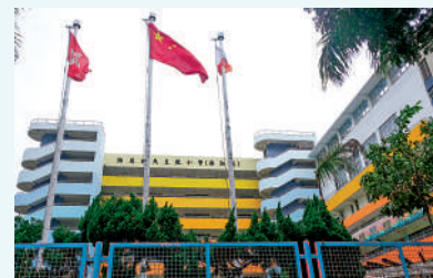
▲「油天海」着重學生在德、智、體、群、美、靈，各方皆有均衡的發展。

選擇，會不會再成爲校長帶領學校？她凝視着桌上的一點說：「如果可以遲一些做校長就好了。」她解釋，因爲她太年輕就成爲校長，與學生相處的時間很少，校長和老師相比，始終與學生隔了一重。她自己也是在上學時遇到好老師而投身這行業，沒想到機緣巧合下成爲校長。陳校長以堅定的眼神看着記者說：「我會盡力去做好一個校長。」