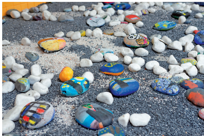
▲校園一角放置着由學生繪畫的石頭畫。