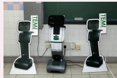
▲學校致力培養學生對STEM的興趣，購置機械人等多種智能設備。