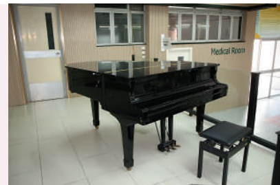
▲學校重視學生在音樂方面的培育，除設有音樂室，亦給每位學生學習管弦樂的機會。