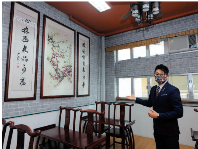
▲圖書館中設置可供學生寫書法的地方。