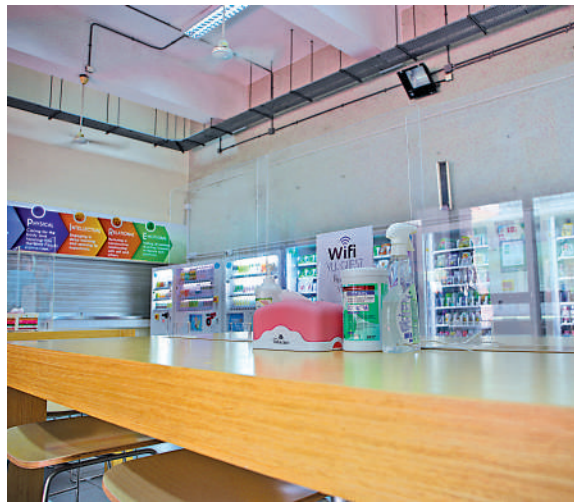
▲學校做好防疫措施，令學生可在安全的環境下上課和進行課外活動。