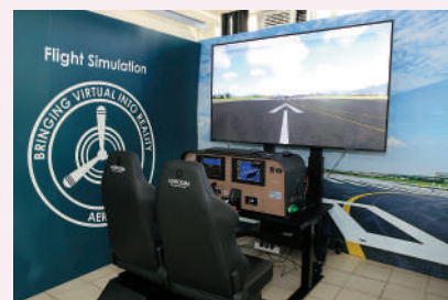
▲學校投放資源在不同範疇，更設有虛擬飛機升降體驗的設備。