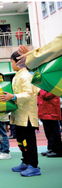
▲特首李家超是五邑工商總會學校的校友。圖為李家超在2018年到訪母校為鑽禧校慶主禮。