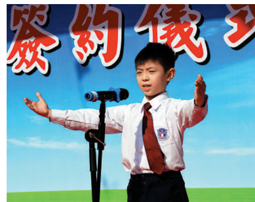
◀▲學校開設多元化的課外活動，包括拉丁舞、朗誦班等，讓學生發揮才能。