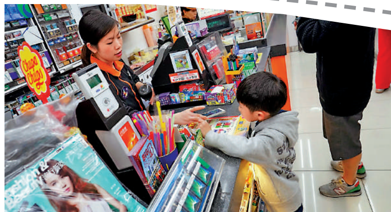
◀八達通功能轉移至手機，學生乘車和購物會更方便。