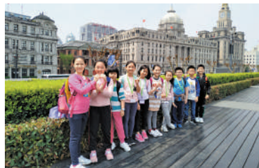
▲學校設有境外交流團，除了探訪小學，更與當地學生一同學習和遊戲。圖為學生到上海交流。

本着基督精神，聖匠小學以「非以役人，乃役於人」為校訓。該校計劃明年進行學時優化，每周抽出兩小時幫助學生完成「其他學習經歷」，培養良好的品性。除了學習打領帶、買菜擇菜等生活技能，以及參觀M+博物館等活動，學校還會組織學生