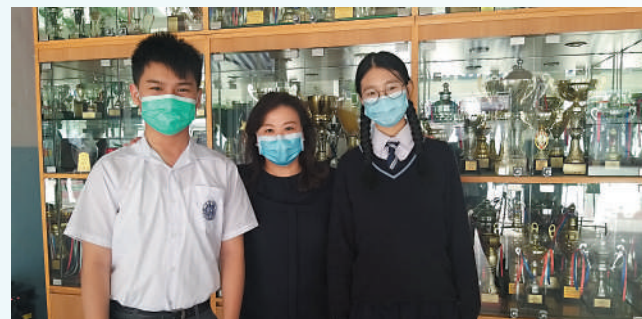
◀畢業生時常回校探望老師，並會幫忙做義工。

會聖匠小學的學生成績亦在逐步提高。去年，該校79個畢業生中有76人考獲第一志願。伍校長表示：「在家長群中，我們的口碑都提升了。」