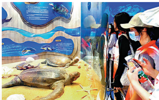
▲惠東開展海龜保護區青少年自然教育導師培訓班活動。

負責老師以通俗易懂、圖文並茂的形式，清晰講述海洋生物的演化過程，如海洋對於地球的重要性、保護海龜的重要性等。老師亦教授普及海洋保護知識，以及海洋塑料污染對海洋動物和人體健康的危害，希望借助青年力量，營造全社會熱愛海洋、保護海洋的濃厚氛圍。