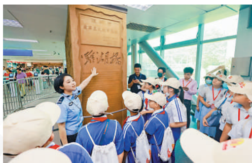
▲大灣區青少年代表齊聚羅湖參加愛國主題活動。

活動尾聲，領導嘉賓還與三地青少年代表移步「同源林」，共同種下代表三地情誼和愛國情懷的小樹苗。