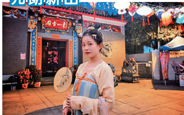
◀穿上漢服的演員演繹元宵短劇，增添氣氛。