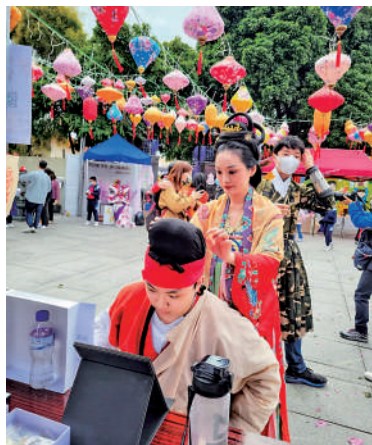
▲團體會在活動現場提供漢服攝影服務，讓市民樂在其中。