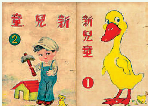
▲《新兒童》半月刊是香港第一本綜合兒童文學雜誌，於1941年創刊。

（註：《新兒童》半月刊於1941年創刊，1942年在廣西桂林復刊，至1944年9月日本入侵桂林後暫停出版。1946年回港復刊，1949年後分為香港和國內兩個版本，香港版的《新兒童》出版不久便宣告停刊。）