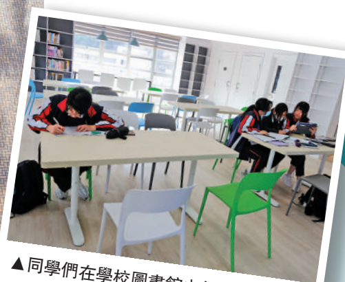
▲ 同學們在學校圖書館內努力溫習。