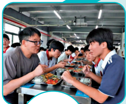
▲教師與學生在校園一起用餐，拉近彼此距離。

珠海逐步取消學校教職工食堂，截至5月22日，全市已有57所公辦中小學全面取消教職工食堂，推行師生「同餐同菜同價」，與教師同餐的學生人數達10多萬人。師生同餐同食，飯菜同質同享，深受學生及家長一致好評。