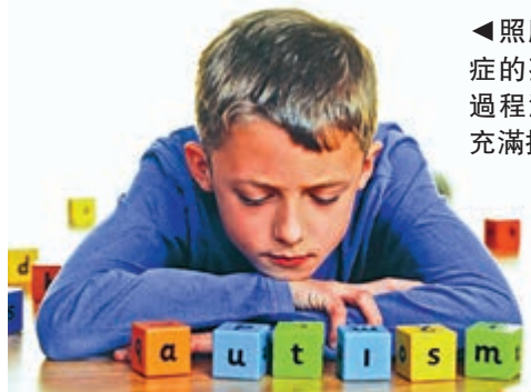
◀照顧自閉症的孩子，過程漫長且充滿挑戰

問：唉！每個有自閉症孩子的父母都知道，這是一個需要長期作戰的問題，但如飛行安全指引：家長要先自己戴好氧氣面罩才替孩子戴。