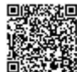
掃描QR Code上大公網 瀏覽更多健康資訊

任何類型的骨折當然都必須盡快作出適當的處理，但礙於舟骨骨折症狀與一般扭傷相似，因此很多時都會出現延誤醫治的情況。