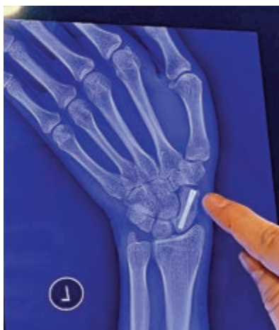
▲新式手術的原理是利用手術螺絲貫穿斷骨將其固定