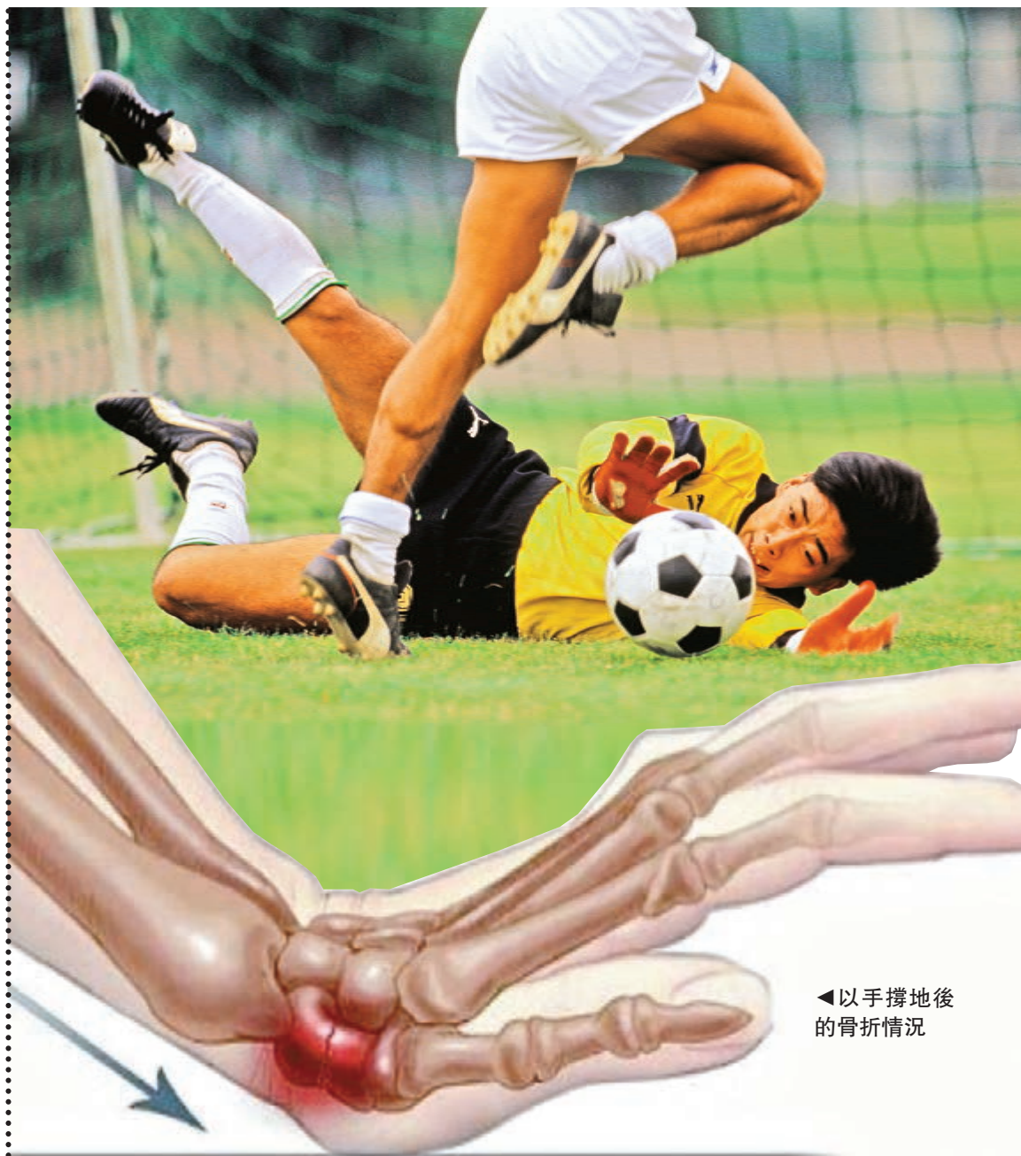
▲足球守門員是發生舟骨骨折的高危群