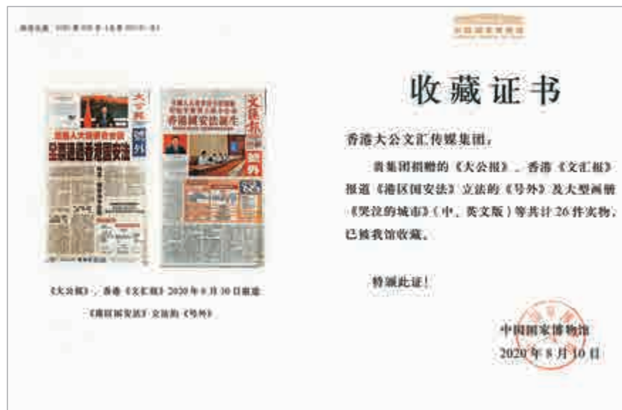
▲中國國家博物館向香港大公文匯傳媒集團頒授的收藏證書

【大公報訊】近日，中國國家博物館向香港大公文匯傳媒集團頒授收藏證書，正式永久收藏《大公報》和香港《文匯報》報道香港國安法立法的《號外》及大型畫冊《哭泣的城市——香港修例風波實錄》（中、英文版）等共26件實體刊物。這26件實體刊物包括5月22日《大公報》號外六件，香港《文匯報》號外六件；6月30日《大公報》號外六件，香港《文匯報》號外六件；中、英文版大型畫冊《哭泣的城市——香港修例風波實錄》各一件。