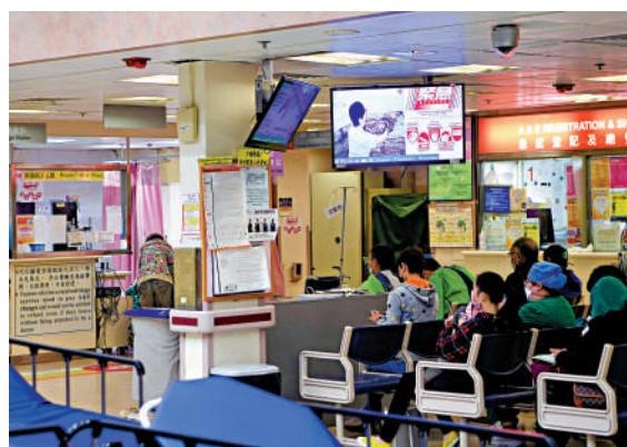
▲根據醫管局紀錄，本年至今錄得29宗類鼻疽個案，是近六年來最多。

「明察秋毫」健康展覽於10月15及16日於馬鞍山新港城中心舉行首兩場，10月22日及23日在藍田麗港城商場舉行，10月29日及30日在荃灣荃新天地二期舉行。