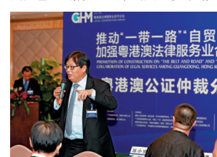
▲大灣區人才簽注政策，將極大推動粵港澳仲裁交流與合作。

裁選擇在港澳，內地仲裁員經常需要在內地參與涉港澳業務，以及前往港澳與國內外當事人對接。「接下來，我們會組織律所的仲裁員盡快申請大